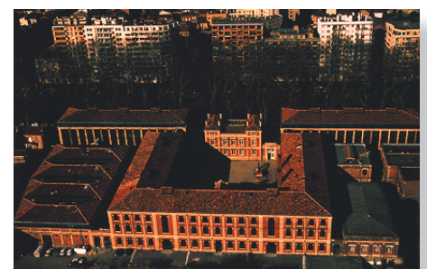
Vue générale aérienne